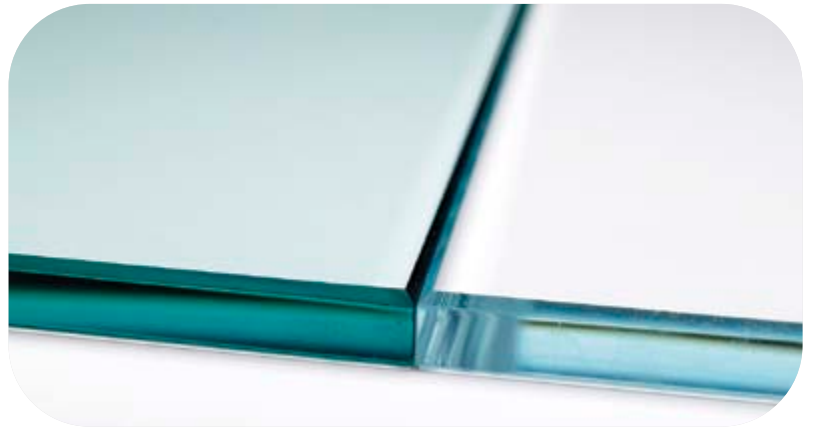
Pilkington Optifloat™ klar